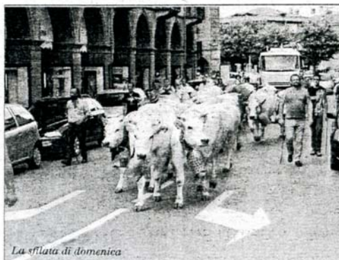
La sfilata di domenica