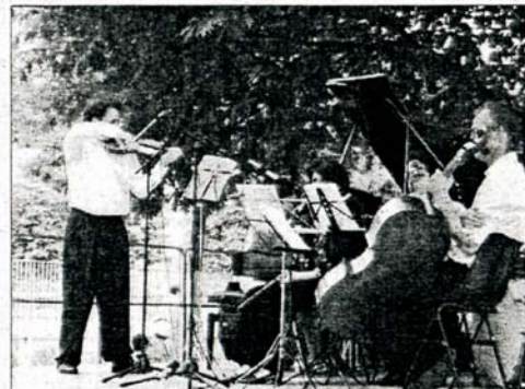
Il concerto dell'Ensemble Antidogma